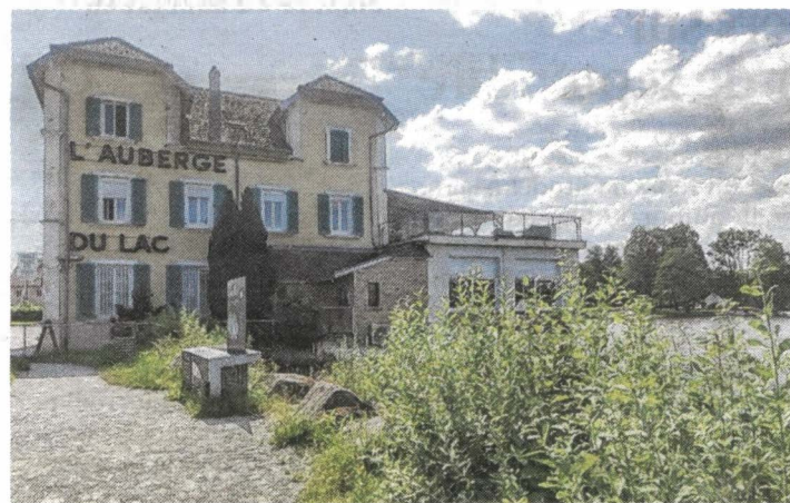
L'Auberge du lac a ouvert ses portes vers 1929.